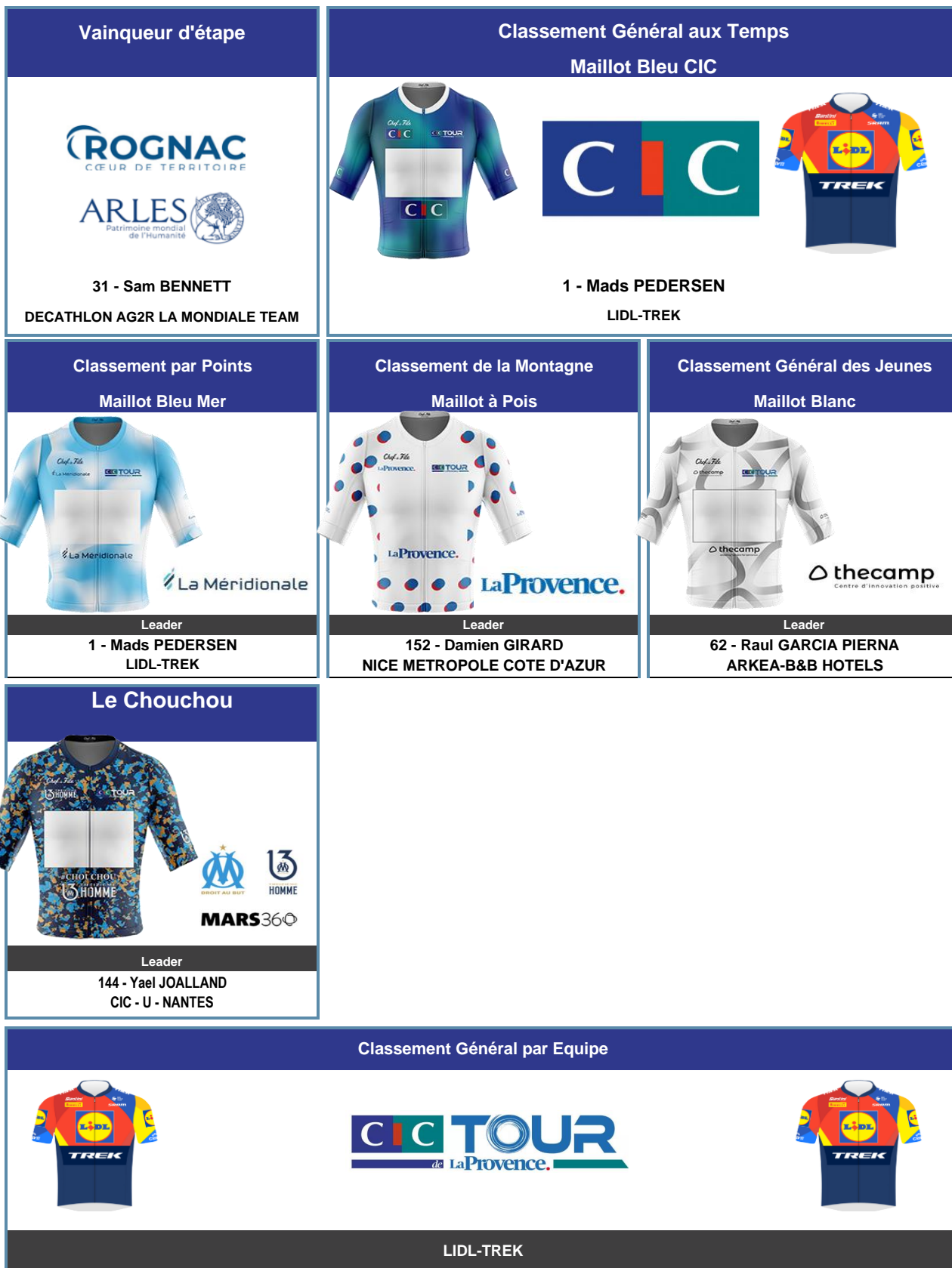
TABLEAU D'HONNEUR FINAL